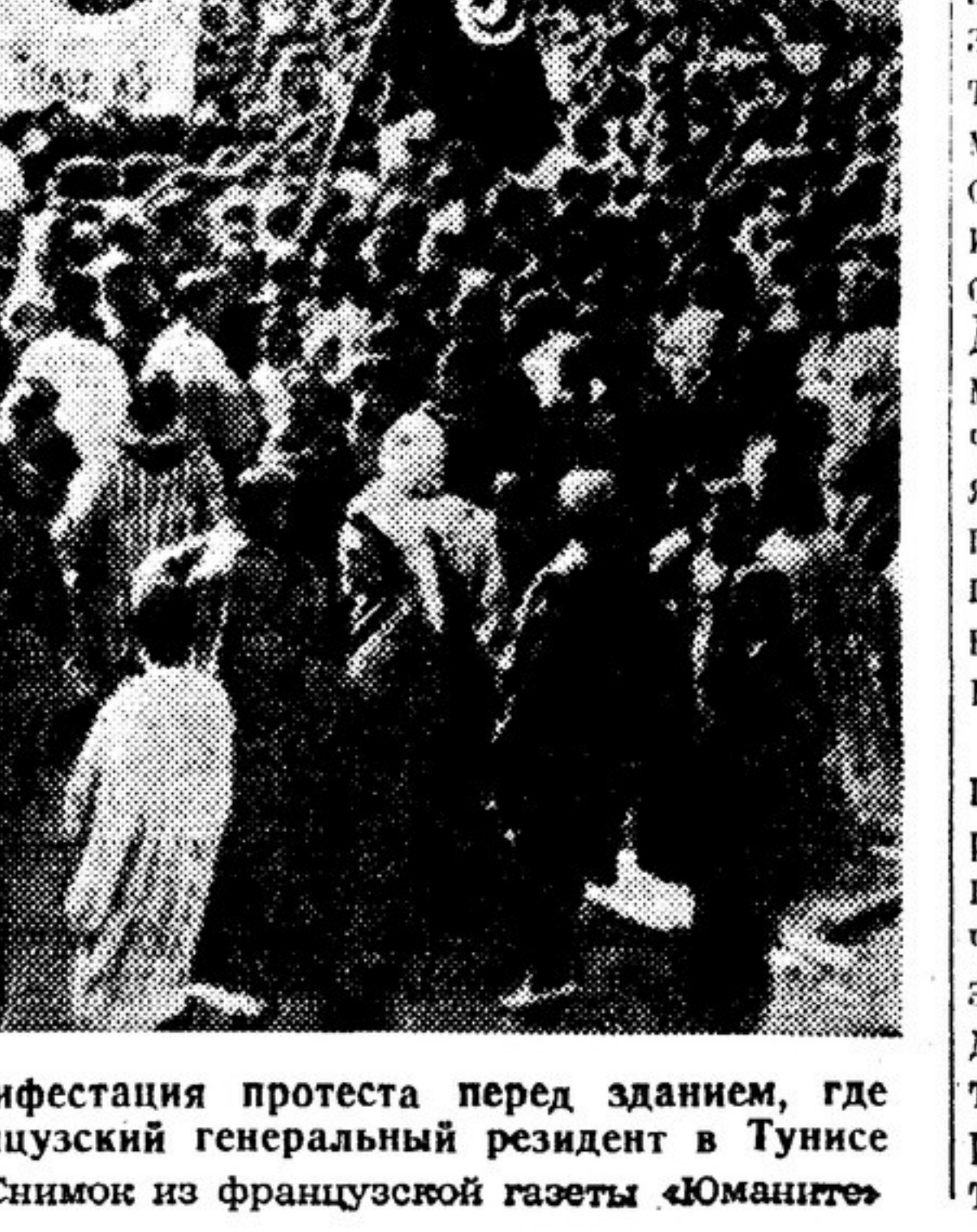
Народная манифестация протеста перед зданием, где помещается французский генеральный резидент в Тунисе