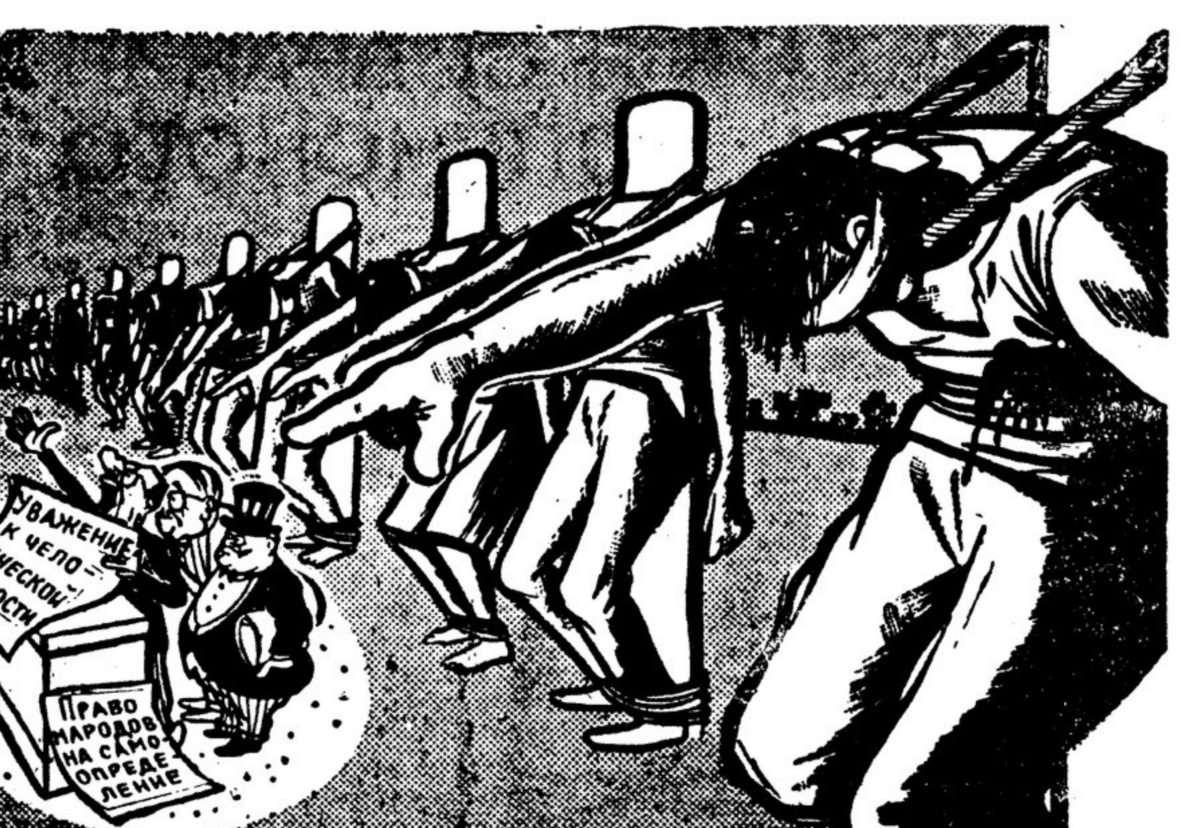
Жертвы обвиняют французских колонизаторов. Рисунок худ. Венсана Карье из французского еженедельника «Франс нувеэль».